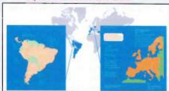
Expansión de ENDESA 2006