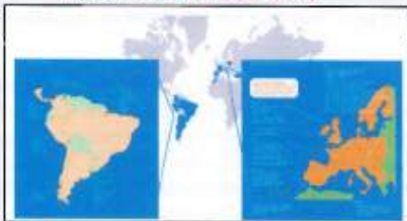
Expansión de ENDESA 2006