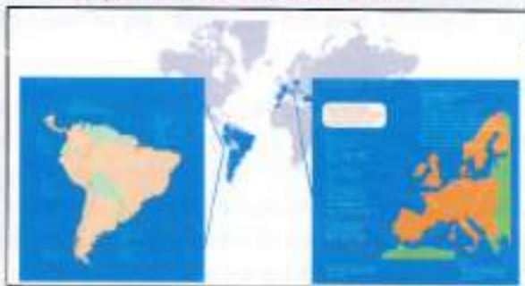
Expansión de ENDESA. 2006