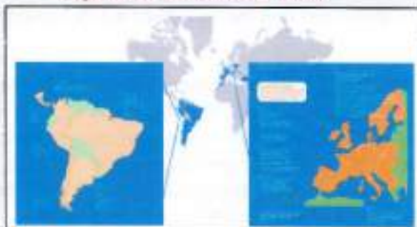
Expansión de ENDESA 2006