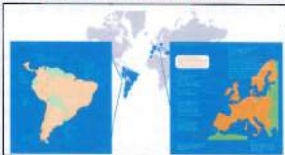
Expansión de ENDESA 2006