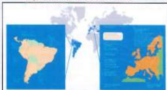
Expansión de ENDESA 2006